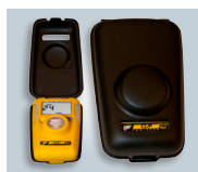
Футляр для энергосберегающего режима