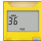
Удобство считывания данных