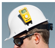
Зажим для каски